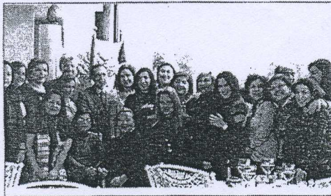
الوفد مع رئيس الغرفة العربية اليونانية ومع السفير اللبناني والأمين العام