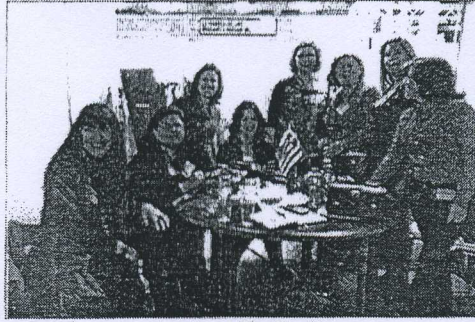
جناح الغرفة في المعرض