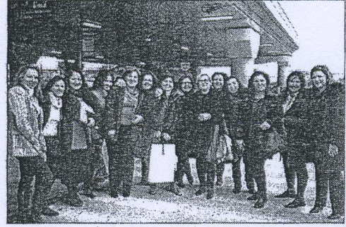
وصول الوفد الى مطار أثينا